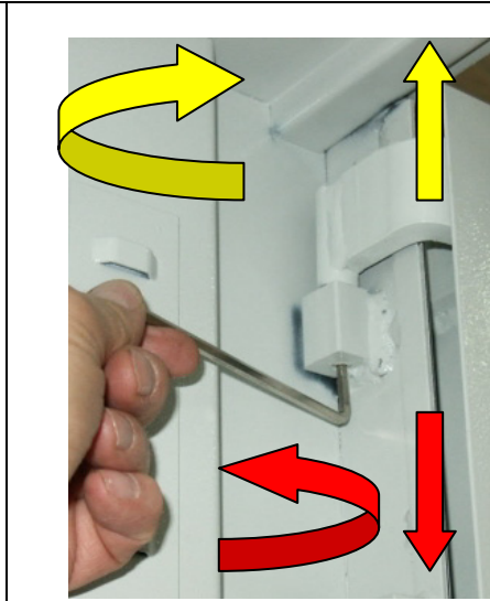
Oberes Türband (Bild 2)