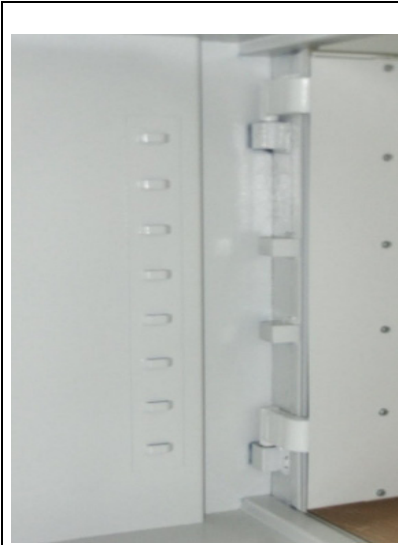
Ansicht der Türbänder (Bild 1)