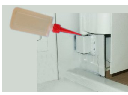
Unteres Türband (Bild 5)

Etwas Öl in die Vertiefung zwischen Ober- und Unterteil geben, ablaufendes Öl abwischen.