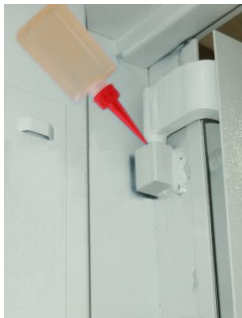
Oberes Türband (Bild 4)