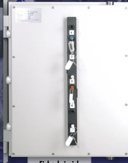
Einbaubeispiel HTS 320-01