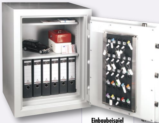
Einbaubeispiel HTS 320-04