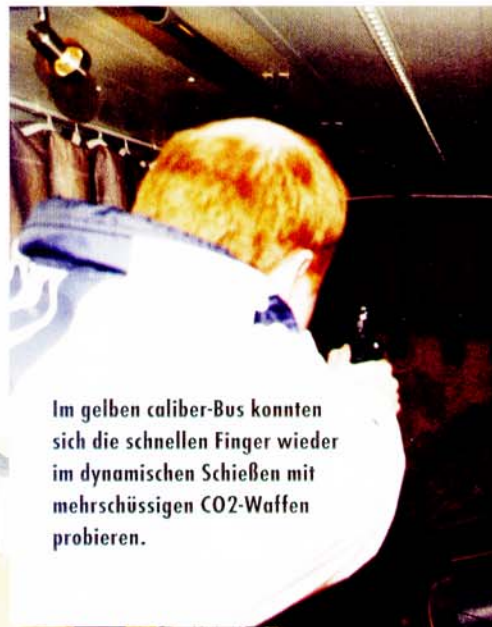
Im gelben caliber-Bus konnten sich die schnellen Finger wieder im dynamischen Schießen mit mehrschüssigen CO2-Waffen probieren.

Auf dem Sektor der Sammlerexponate sowie Antik- und Gebrauchtwaffen gab es - neben dem üblichen Surplus-Schrott in Hülle und Fülle - auch durchaus interessante Objekte zu entdecken. Auch Schützen, Jäger, Reservisten und sonstige Waffenfreunde, deren Interessenschwerpunkt auf modernen Produkten lag, kamen auf ihre Kosten. So waren neben den beiden dominierenden Großkaliber-Schießsportverbänden BDS und BDMP einige Firmen vertreten, die modernere Exponate ausstellten. Besonders interessant auf diesem Gebiet und sicherlich eines der Highlights der Börse war das neu gefertigte Unterhebelrepetiergewehr nach Win-